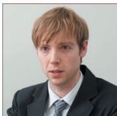
株式会社アーバンブレイン 最高技術責任者