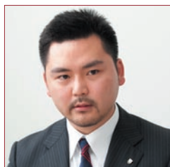
株式会社アーバンブレイン 代表取締役社長

インターネットの世界に新たな変化が起きようとしている。従来、厳しく制限されていたURLの末尾にある「.com」などの表記が自由化されるのだ。果たして、この変化はビジネスにどのような影響を与えるのか。ドメイン名登録サービスで高い実績を誇るインターリンクの関連企業であり、この分野のコンサルティングサービスを提供するアーバンブレインのキーマンに話を聞いた。